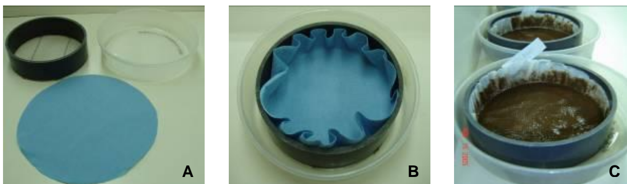
Figura 4. A) Cilindro de PVC, palangana plástica, papel filtro, B) Bandeja ensamblada y C) Bandeja ensamblada con muestra de suelo.

La carencia de oxígeno, especialmente en la base del embudo donde los nematodos son colectados y el problema de que estos se alojan en las paredes inclinadas del mismo, son otras desventajas del método. Sin embargo, estos inconvenientes pueden ser superados, sustituyendo el embudo por una palangana pequeña y colocando la muestra en el papel toalla o tela dentro de un cilindro de PVC de 17 cm de diámetro con fondo de malla. Es importante sujetar al fondo del cilindro de PVC un par de alambres, la separación de unos milímetros del fondo de la palangana, favorece el paso de los nematodos a través del papel filtro. La palangana debe de contener un volumen de agua suficiente que haga contacto con la muestra colocada en el papel filtro (figura 4). Todas las formas activas de nematodos son recuperadas después de 18 a 24 horas. La eficiencia del método depende entre otras cosas, de la movilidad de los nematodos y el tipo papel filtro o tela utilizada.