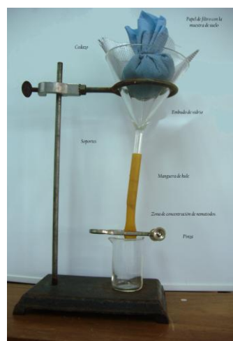
Figura 2. Embudo de Baerman mostrando sus principales componentes.

El embudo se coloca en un soporte y se llena con agua potable. Posteriormente, pequeñas cantidades de suelo (50 – 100 cc), material vegetal u otro tipo de materia orgánica, son colocadas dentro de una bolsa de tela porosa o papel, la cual se sumerge suavemente en el agua del embudo. Una de las variantes que se puede implementar consiste en colocar a pocos milímetros del borde superior del embudo, un cedazo o malla de alambre cuya función es soportar la muestra, la que es vertida sobre tela o papel, cuya consistencia, textura y porosidad puede variar.