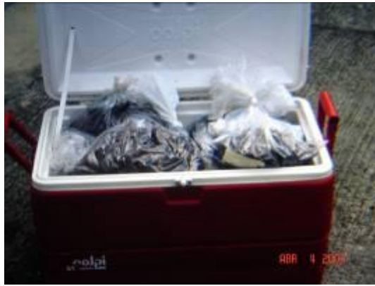
Figura 1. Almacenamiento y envío de muestras al laboratorio en un contenedor de aislamiento térmico (hielera).