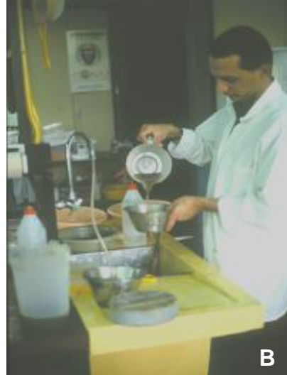
Figura 6. Extracción de nematodos de suelo por la técnica del elutriador de Oostenbrink (A) y la técnica de cribado y decantación de Cobb (B).