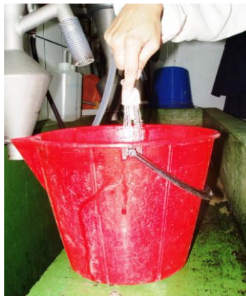
2. Dos lavados de 30 s de suspensión de la submuestra.