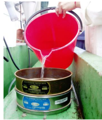
3. Tamizado a través de dos tamices de 100 y 400 mallas