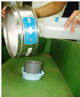
4. Suelo a un cilindro de "PVC" con un fondo de tela o papel.