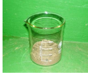
1. Submuestra de 100 cc de suelo.

La técnica del embudo de Baermann modificado según Christie y Perry, ( figura 3 ) consiste en suspender el suelo en un determinado volumen de agua, y después de un corto período de reposo, la suspensión se vierte sobre un juego superpuesto de cribas de 100 y 400 mallas. El suelo retenido en la criba más fina, se transfiere a un cilindro con fondo de tela, que posteriormente se coloca en el embudo. Después de 24 a 48 horas, todas las formas activas de nematodos han pasado a través de la tela o papel y pueden ser recogidas en un pequeño volumen de agua al retirar la pinza mohr de la manguera.