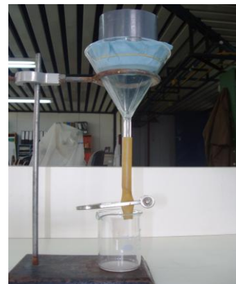
5. El cilindro se coloca en el embudo de Baermann procurando que el papel haga contacto con el agua